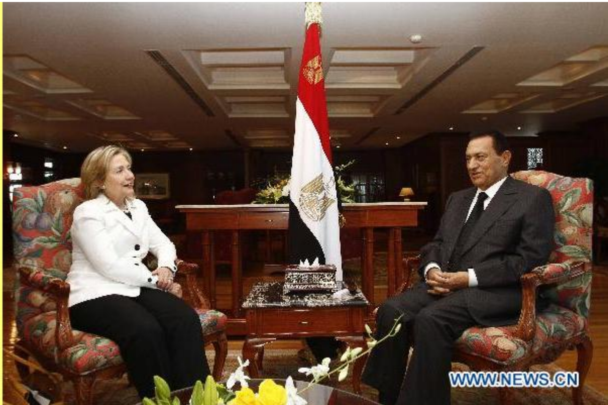
Hillary Clinton e Hosni Mubarak em Sharm El Sheik, Setembro 2010

Sob os auspícios da Freedom House, em Maio de 2008 dissidentes egípcios e oponentes de Hosni Mubarak foram recebidos por Condoleezza Rice no Departamento de Estado e no Congresso dos EUA.