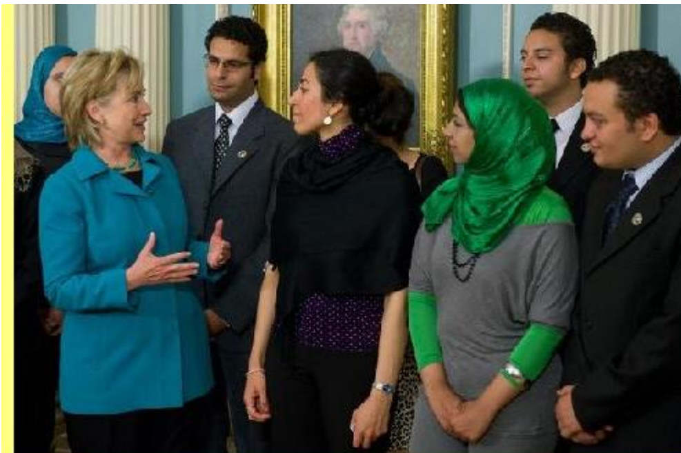
"A secretária de Estado Hillary Clinton fala com activistas egípcios de liberdade e democracia, em visita através da organização Freedom House, antes de reuniões no Departamento de Estado em Washington, DC, 28/Maio/2009".