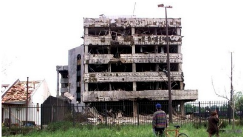
Ambassade de Chine à Belgrade, bombardée par l'OTAN

l'Union soviétique, laissant la Russie comme État successeur, avec les armes nucléaires et le veto de l'URSS aux Nations unies, sous la présidence alcoolique de Boris Eltsine - et l'influence écrasante des États-Unis dans les années 1990.