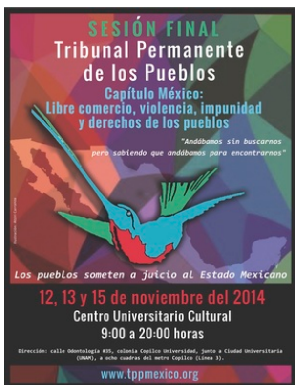
Affiche pour la dernière session du chapitre Mexique du Tribunal Permanent des Peuples (TPP), novembre 2014, ville de Mexico.

En 2013, plusieurs communautés et organisations — la plupart proches de la Red en Defensa del Maíz [Réseau de défense du maïs] et de l'Asamblea Nacional de Afectados Ambientales [une assemblée nationale des personnes touchées par des dégâts environnementales] — ont organisé des ateliers dans diverses régions et localités dans lesquels elles ont méthodiquement relevé les torts causés par l'abandon institutionnel de la campagne, les politiques qui portent atteinte aux peuples autochtones et à la vie paysanne, la dévastation du territoire, de la subsistance et de la vie digne des collectivités, la voracité du système agroalimentaire industriel, et bien sûr, l'irresponsable promotion du maïs transgénique et l'importation massive de maïs de qualité douteuse pour des usages industriels.