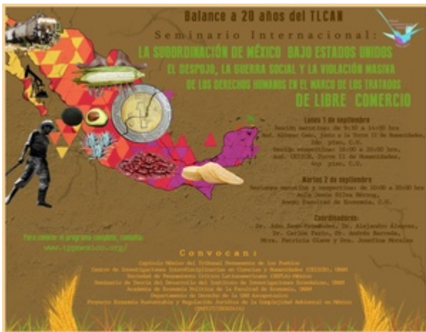
Affiche pour un séminaire sur l'intégration du Mexique dans la politique des États-Unis et le rôle des accords de libre-échange dans les distorsions de la vie nationale mexicaine, dans le cadre du TPP, 2014.

1. L'État mexicain et les sociétés privées détruisent, avec une intensité inusitée, la relation des communautés avec leur territoire, base fondamentale de la subsistance et de la continuité civilisatrice de tout peuple. Avec la contre-réforme de l'article 27 de la constitution, en 1992, et d'autres lois afférentes, on a spolié le caractère inaliénable, insaisissable et imprescriptible de la terre, ce qui a ouvert la possibilité de la louer, vendre, hypothéquer et aliéner au moyen de contrats avec des entreprises et des individus. 9 On a séparé la terre de l'eau et des ressources naturelles et on a aussi séparé les noyaux humains des milieux dont ils ont pris soin pendant des millénaires. Avec la nouvelle réforme énergétique, l'État mexicain cherche à éradiquer la propriété communautaire et « éjidale, » la propriété sociale de la terre, au moyen de lois secondaires qui envisagent « l'occupation » de tout terrain qui recèle un potentiel énergétique, en déclarant que l'exploitation énergétique prime sur toute autre activité. Cette violation ne signifie pas seulement de disposer de la terre abstraite : elle entraîne l'exil forcé de communautés entières et tente d'effacer la mémoire territoriale des communautés et des ejidos. 10