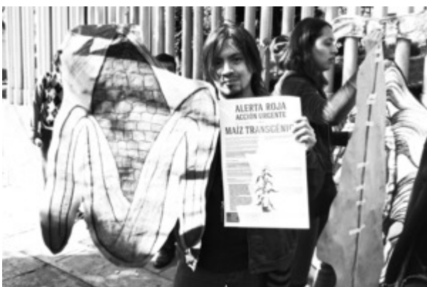
Mobilisation nationale contre l'allocation de permis pour le maïs OGM, octobre-novembre 2012.

Le paragraphe 3.2 de la sentence finale de l'ensemble du processus mexicain du Tribunal permanent des peuples trace un portrait fidèle de cette condition systémique :