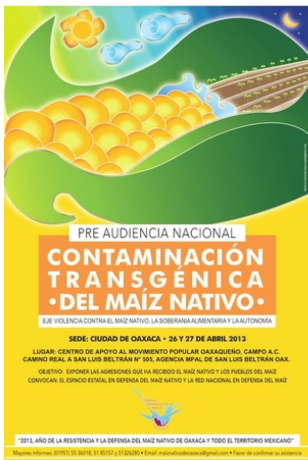
Affiche pour la session préliminaire sur la contamination du maïs transgénique à San Luis Beltran, dans l'Oaxaca, avril 2013.

Les parties lésées soutiennent que l'État mexicain commet un détournement de pouvoir, car certaines instances du gouvernement et cinq sociétés « ont appuyé 73 contestations contre la demande et la mesure de précaution, et ce, en date du 17 septembre 2014; certaines de ces contestations ont déclenché des demandes d'appel, de révision, de révocation et de protection. » 23 Les instances gouvernementales elles-mêmes ne se gênent pas pour appuyer les sociétés dans le but d'instaurer un instrument de contrôle qui privatiserait automatiquement non seulement des variétés particulières, mais aussi des espèces complètes et, éventuellement, l'ensemble des activités agricoles. Cependant, les actions juridiques du gouvernement de concert avec les sociétés, et le détournement du pouvoir qu'ils signifient, visent à bloquer tant la mobilisation que la suspension mise de l'avant par la société civile.