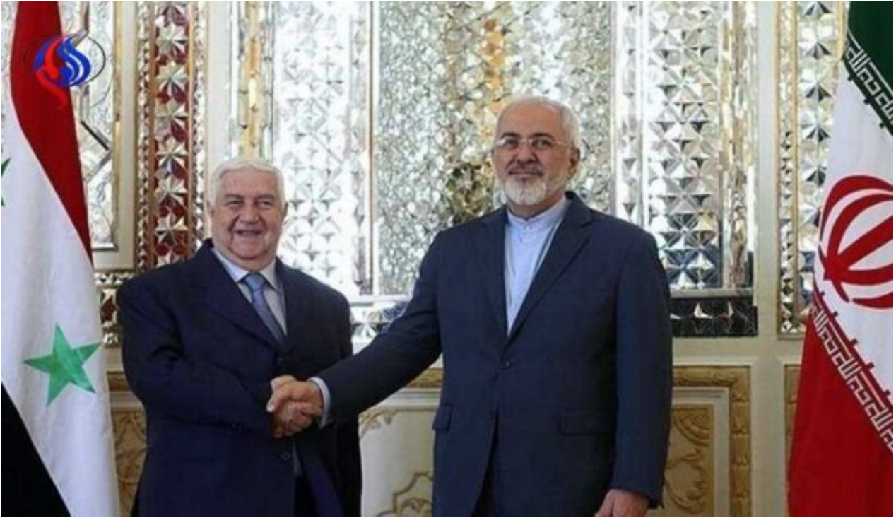
- Walid Al Moallem avec les ministres des Affaires étrangères russe, chinois et iranien.