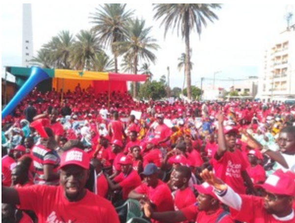
Manifestation des membres du collectif « Auchan dégage » à Dakar, en 2018.

Il serait dangereux de présumer que le taux de pénétration, actuellement assez peu important, des supermarchés dans les systèmes alimentaires africains signifie qu'ils n'ont pas l'intention de s'étendre sur le continent ou qu'ils vont se contenter de servir les 10 % de consommateurs africains qui peuvent se permettre d'acheter des importations de luxe dans des centres commerciaux clinquants. Certaines des plus grandes chaînes de supermarchés, et les multinationales alimentaires qui sont leurs fournisseurs, ciblent de plus en plus les populations urbaines pauvres d'Afrique dans leurs prévisions de croissance, comme on le voit clairement avec Auchan au Sénégal.