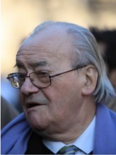
Jack Ralite, ancien ministre communiste (1981-84).

Comme les deux intervenants précédents, Jack Ralite alla de sa diatribe contre Bachar el-Assad, un « bourreau haineux », « un dictateur massacreur qui tue son peuple ». Il se risqua à interpréter la présence de djihadistes sur le sol syrien : c'était une « histoire que certains grossissaient ». Il remercia l'engagement résolu de l'Institut du Monde arabe et se félicita de l'avancée de la mobilisation française. Son intervention fut la plus creuse car il n'avança strictement aucun fait, et pour se donner du crédit multiplia les références pédantes à des sources livresques complètement hors-sujet. Nous eûmes ainsi droit à des citations de Camus, de René Char, de Hölderlin, de Boulez, de Bukowski, d'Aragon, de Ricoeur. L'homme parlait avec emphase et semblait heureux d'étaler sa culture.