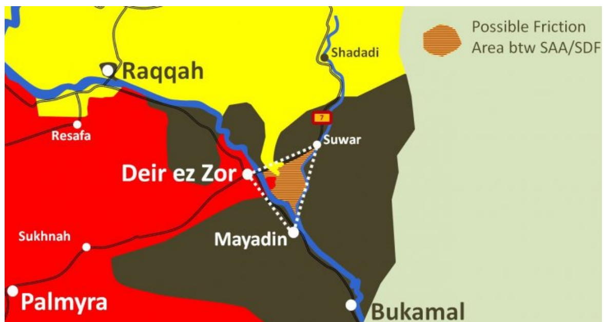
carte de Weekend Warrior

Cette carte montre la zone de conflit actuellement concernée (forces par procuration américaines en jaune, Armée arabe syrienne en rouge, EI en noir) :