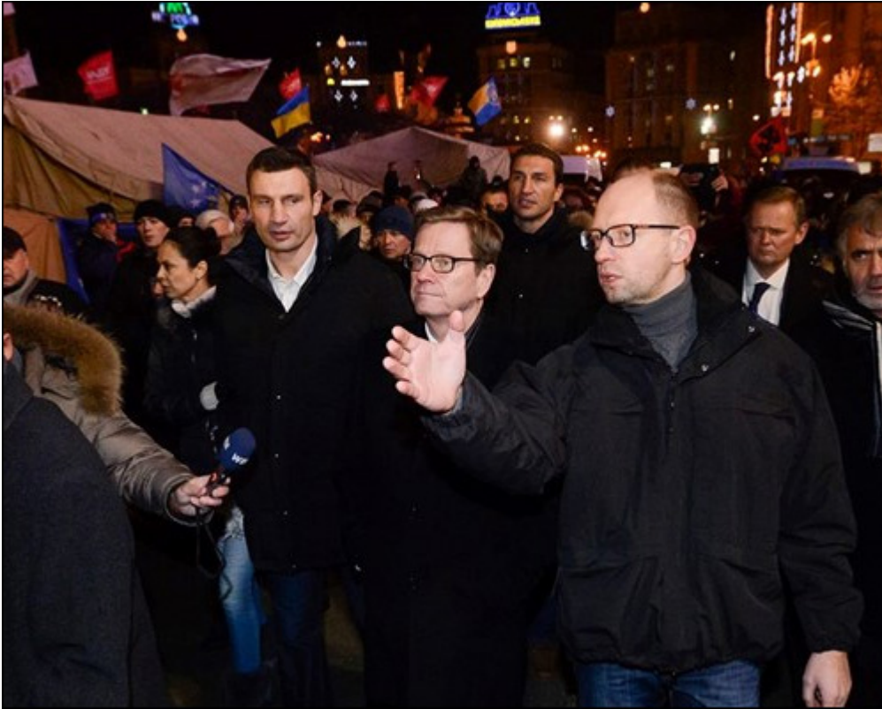
Klitschko, Guido Westerwelle et Iatseniouk

D'autre part, la chancelière allemande a, comme son ministre, reçu Iatseniouk et Klitschko le 17 février 2014 à Berlin. Le candidat sur lequel ont misé Merkel, le CDU et son think tank, la Fondation Konrad Adenauer, est Klitschko [82]. Néanmoins, le parti de Timochenko est aussi considéré comme un allié du PPE et du CDU ainsi que l'avait affirmé M. Martens lors d'un discours au Club de la Fondation Konrad Adenauer en 2011 : « Ioulia Timochenko est une amie de confiance et son parti est un membre important de notre famille politique ». Dans ce même discours, il avait déclaré que sa position était similaire à celle de McCain quant au soutien à Timochenko (pour sa libération lorsqu'elle était emprisonnée) [83].