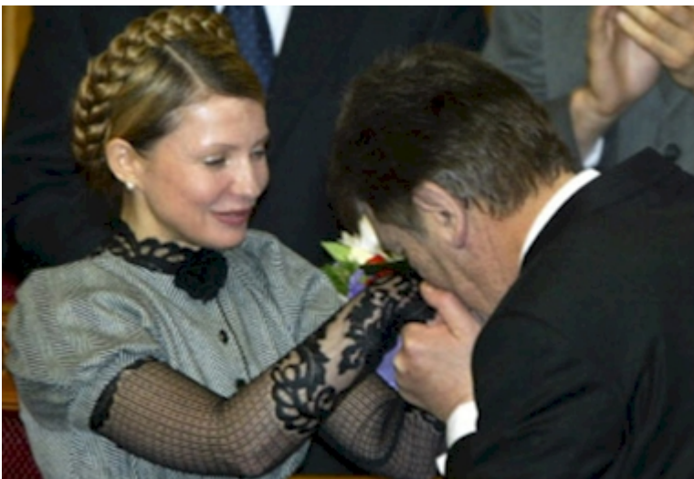
Le couple Iouchtchenko - Timochenko

En 2004, la « révolution » orange éclate et Timochenko en devient l'égérie. Iouchtchenko accède à la magistrature suprême en 2005 et, elle, au poste de premier ministre par deux fois. Toutes les accusations sont, comme par enchantement, oubliées.