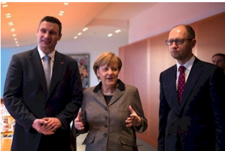
Klitschko, Merkel et Iatseniouk

D'autre part, la chancelière allemande a, comme son ministre, reçu Iatseniouk et Klitschko le 17 février 2014 à Berlin. Le candidat sur lequel ont misé Merkel, le CDU et son think tank, la Fondation Konrad Adenauer, est Klitschko [82]. Néanmoins, le parti de Timochenko est aussi considéré comme un allié du PPE et du CDU ainsi que l'avait affirmé M. Martens lors d'un discours au Club de la Fondation Konrad Adenauer en 2011 : « Ioulia Timochenko est une amie de confiance et son parti est un membre important de notre famille politique ». Dans ce même discours, il avait déclaré que sa position était similaire à celle de McCain quant au soutien à Timochenko (pour sa libération lorsqu'elle était emprisonnée) [83].