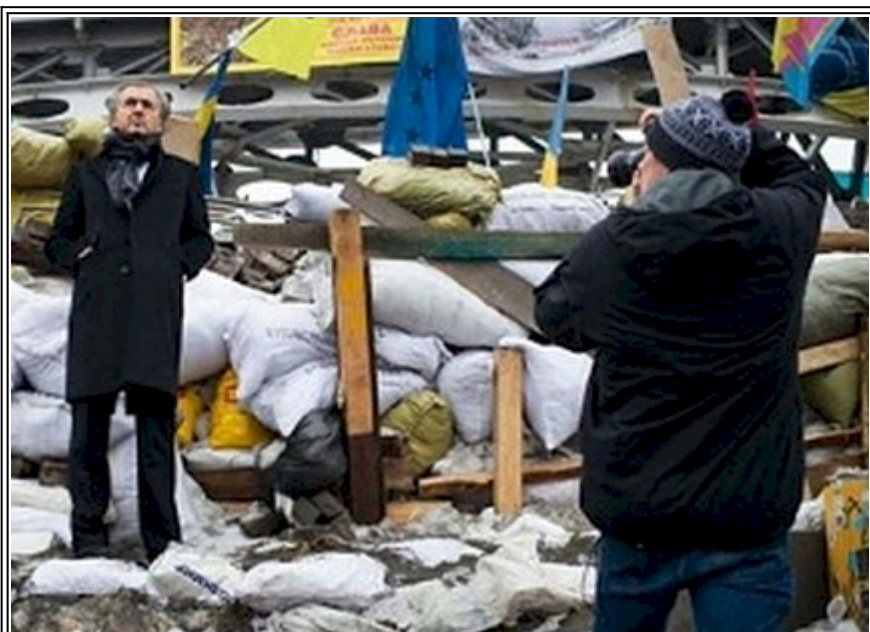
BHL posant à Kiev

« Au début, [les meneurs] étaient les députés de l'opposition Iatseniouk, Klitschko et Tyahnybok. Ces trois personnes menaient le Maïdan. Mais, ensuite, c'est le Pravy Sektor qui a pris les choses en main. Depuis la mi-décembre, la politique du Maïdan a été dictée par Pravy Sektor qui est une alliance de différents partis et mouvements néo-nazis. Ce sont des groupes paramilitaires, des terroristes très bien entraînés » [45].