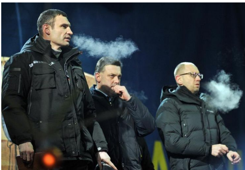
Les leaders du « Groupe d'action pour la résistance nationale »: Klitschko, Tyahnybok et Iatseniouk

Les trois partis cités précédemment ont formé une alliance appelée « Groupe d'action pour la résistance nationale » pour mener à bien la déstabilisation du gouvernement Ianoukovytch. En plus, on vient d'apprendre qu'une nouvelle coalition a été créée au parlement ukrainien post-Ianoukovytch. Nommée « Choix européen », elle réunit 250 députés de différents groupes parlementaires dont Batkivtchina, UDAR et Svoboda [27].