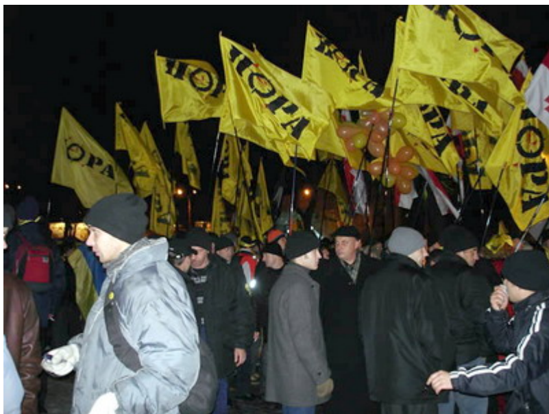
Manifestants de la « révolution » orange

eux, Otpor, est celui qui a causé la chute du régime serbe de Slobodan Milošević. Après ce succès, il a aidé, conseillé et formé tous les autres mouvements par l'intermédiaire d'une officine spécialement conçue pour cette tâche, le Center for Applied Non Violent Action and Strategies (CANVAS) qui est domiciliée dans la capitale serbe. CANVAS forme des dissidents en herbe à travers le monde à l'application de la résistance individuelle non violente, idéologie théorisée par le philosophe et politologue américain Gene Sharp dont l'ouvrage « From Dictatorship to Democracy » (De la dictature à la démocratie) a été à la base de toutes les révolutions colorées.