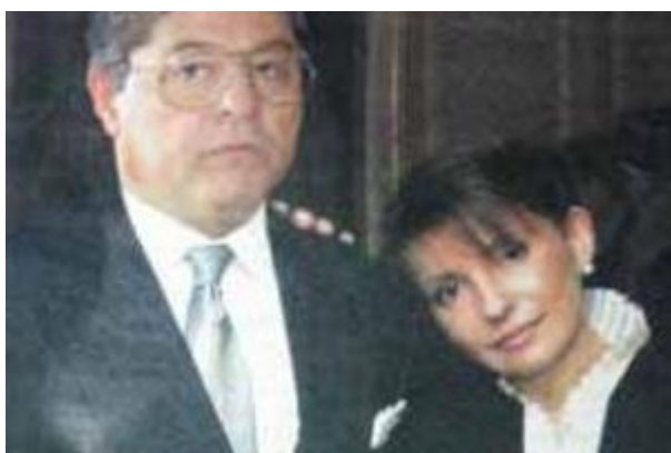
Lazarenko et Timochenko

Lazarenko est nommé vice-Premier ministre chargé de l'énergie. Très certainement favorisés par les leviers politiques inhérents au poste de Lazarenko, les résultats de SEUU explosent : 10 milliards de dollars de chiffre d'affaires et 4 milliards de profits pour l'année 1996! Et tout cela grâce à des contrats très lucratifs reliés à la vente en Ukraine de gaz naturel russe [48]. Les années de bonheur continuent avec la promotion de Lazarenko au poste de Premier ministre en mai 1996, bien qu'il échappât à un attentat à la bombe à peine 2 mois plus tard [49]. Au début de l'année 1997, la SEUU contrôlait plusieurs banques, avait des participations dans des dizaines d'entreprises de la métallurgie et la construction mécanique, était copropriétaire de la troisième plus grande compagnie aérienne de l'Ukraine et de son deuxième plus grand aéroport, celui de Dnipropetrovsk, en plus de participation dans le développement de gazoducs turcs et boliviens, ainsi que le contrôle de plusieurs journaux locaux et nationaux [50].