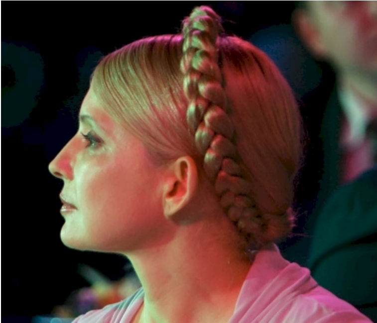
Timochenko et son look actuel

En 2004, la « révolution » orange éclate et Timochenko en devient l'égérie. Iouchtchenko accède à la magistrature suprême en 2005 et, elle, au poste de premier ministre par deux fois. Toutes les accusations sont, comme par enchantement, oubliées.