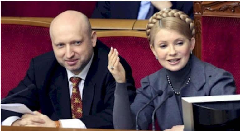
Olexandre Tourtchinov et Ioulia Timochenko

Tout d'abord, il y a « Batkivshina » ou Union panukrainienne « Patrie » qui est un parti politique dont le leader est Ioulia Timochenko, secondée par Olexandre Tourtchinov, un ami de longue date, considéré comme son « fidèle écuyer » [16]. C'est ce dernier qui a été récemment nommé président intérimaire de l'Ukraine après le départ de Ianoukovytch.