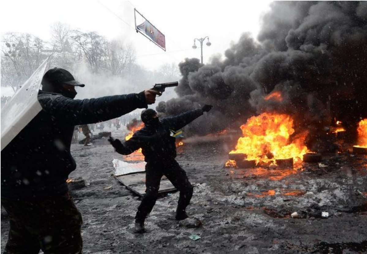
Un manifestant arme au poing pendant un affrontement avec la police, place de l'Indépendance, à Kiev, le 22 janvier