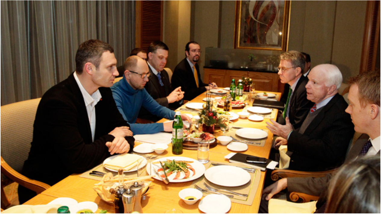
McCain rencontre Klitschko, Iatseniouk et Tyahnybok (décembre 2013)

L'ingérence américaine s'est aussi illustrée par « l'affaire Nuland » qui a montré que le vocabulaire diplomatique utilisé par certains hauts fonctionnaires américains n'avait rien à envier à celui des charretiers. « Fuck the UE! », s'est-elle exclamée. Ce qui en dit long sur la lutte d'influence qui oppose l'oncle Sam au vieux continent.