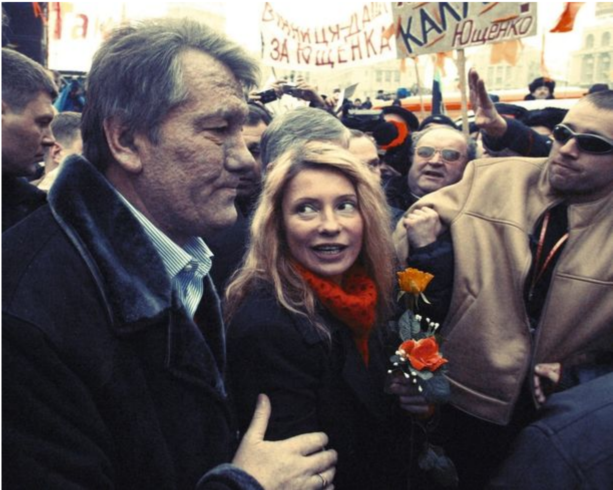
Timochenko blonde, mais sans tresses

C'est pendant cette période qu'elle change de look. De brune, elle devient blonde.