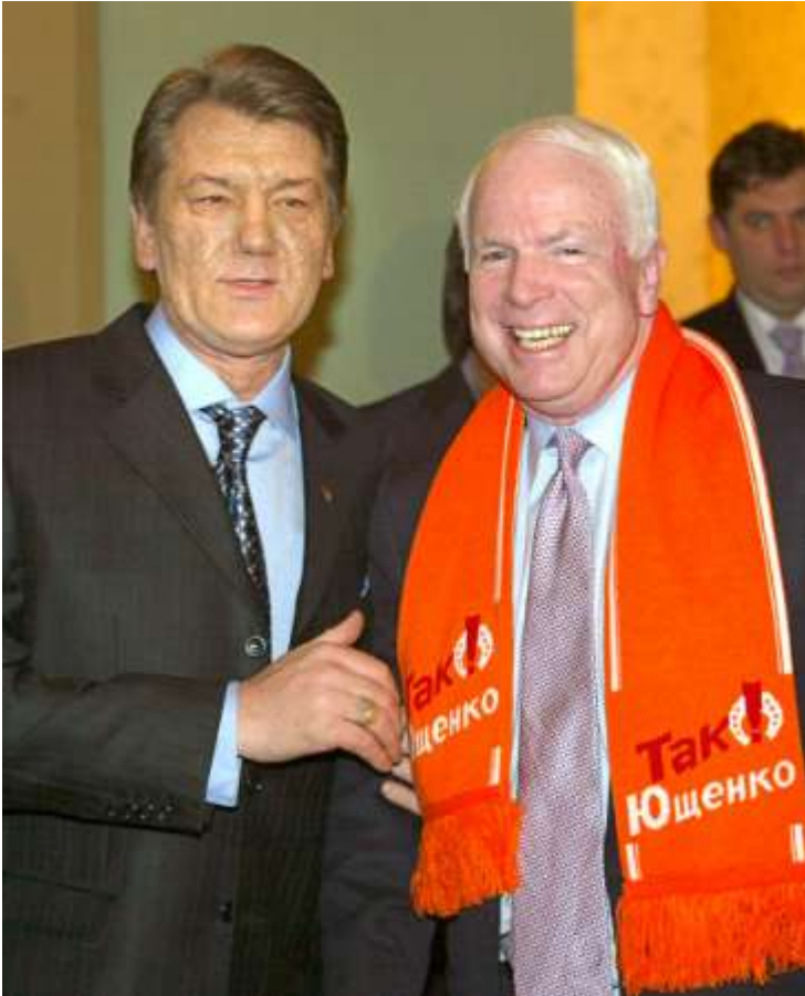
Iouchtchenko et McCain (février 2005)

Le sénateur américain s'est aussi rendu dans les pays arabes « printanisés » : Tunisie (21 février 2011), Égypte (27 février 2011), Libye (22 avril 2011) et Syrie (27 mai 2013). Lors des deux premiers voyages, les gouvernements étaient déjà tombés. Dans les deux derniers, la bataille faisait rage (elle le fait encore en Syrie).