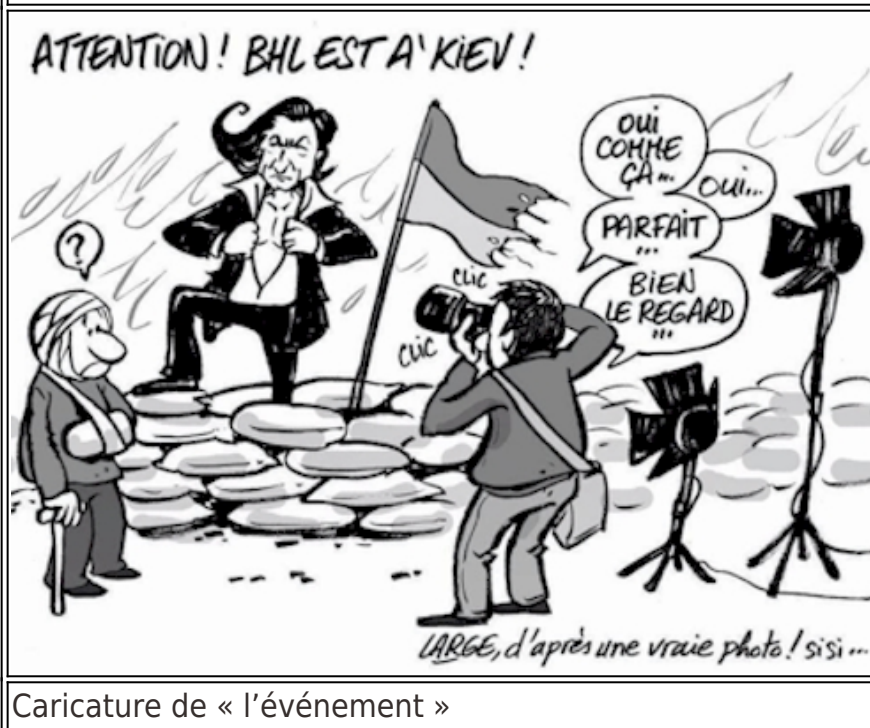
Caricature de « l'événement »