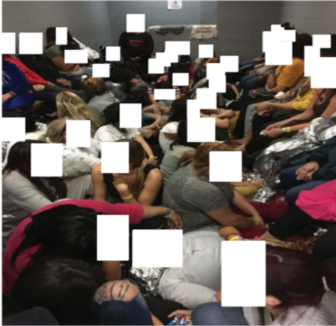
Figure 1: Overcrowding of Adult Females in PDT Holding Cell Observed by OIG on May 8, 2019