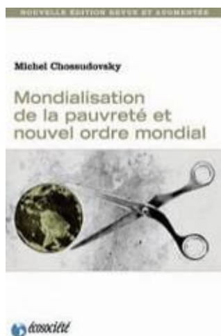
Mondialisation de la pauvreté

La source originale de cet article est Mondialisation.ca