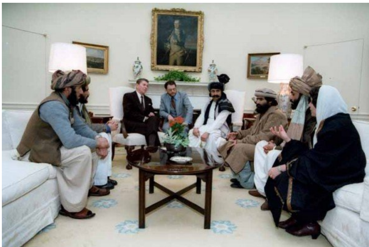
Ronald Reagan rencontre les commandants des moudjahidines afghans à la Maison-Blanche en 1985

Ronald Reagan a appelé les terroristes des « combattants de la liberté ». Les États-Unis ont fourni des armes aux brigades islamiques. C'était pour « une bonne cause » : la lutte contre l'Union soviétique et un changement de régime ayant mené à la disparition d'un gouvernement laïc en Afghanistan.