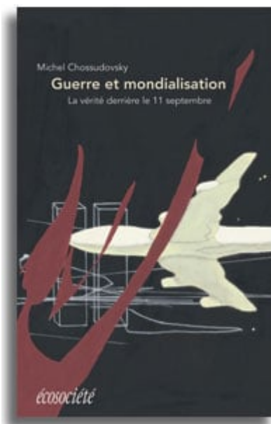
Guerre et mondialisation