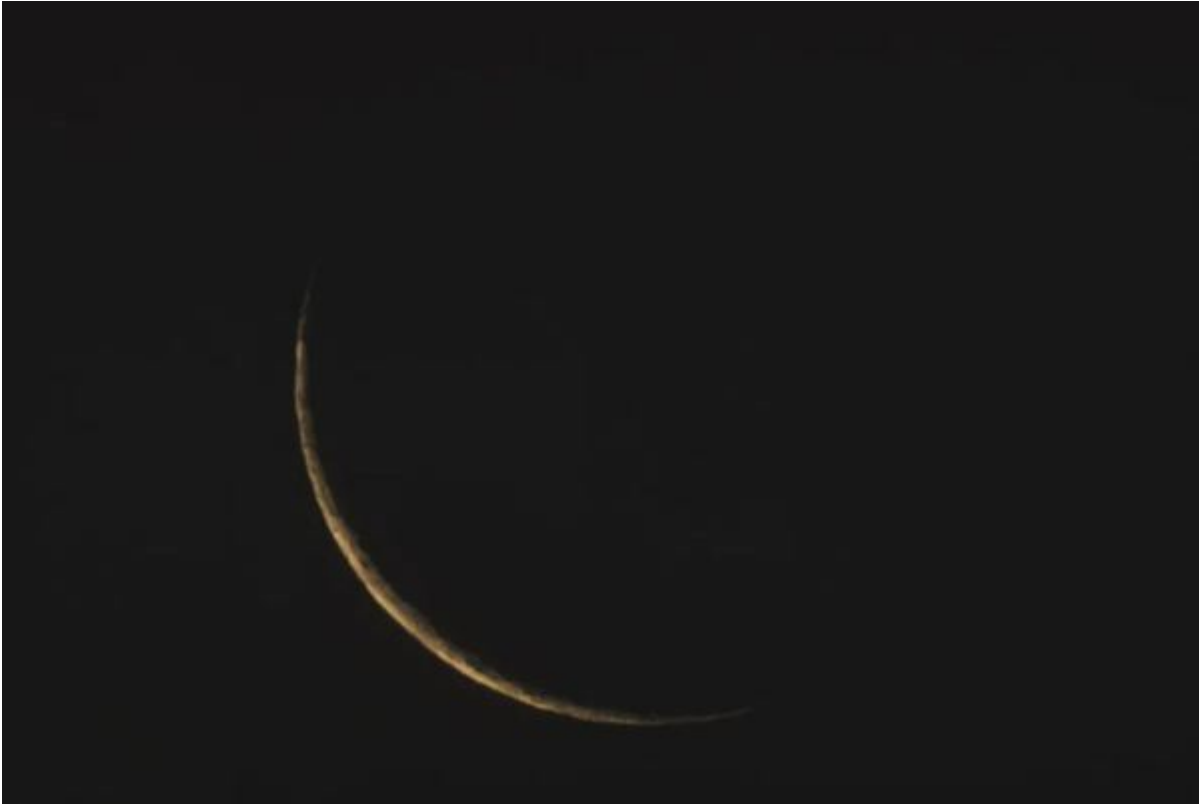
Presque une lune noire

La dichotomie qui a été tant soulignée entre « se soucier de la vie ou se soucier de l'économie » montre en soi à quel point le monde était déjà absurde. Combien de gens se sont si facilement fait prendre à séparer une chose de l'autre, comme si c'était un moyen de résister au système et de dire finalement non aux exigences de l'accumulation du capital. Pour finalement voir, en effet, les petites entreprises dévastées, la pauvreté augmenter de façon drastique, tandis que les milliardaires concentrent la richesse à des niveaux encore plus déconcertants.