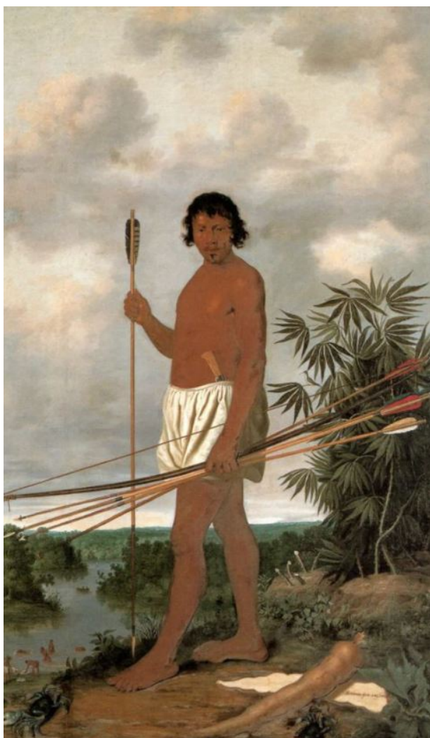
Peinture d'Albert Eckhout représentant un homme Tupi. source : Wikipedia

Pour contrer l'objectivation de l'homme, il est peut-être opportun de s'inspirer de la conception que Tupis se faisait de l'être humain : tu + pi, son assis. Un être humain est un son qui s'est assis, qui a pris place et qui vibre. Il faut que nos corps, nos visages et nos mots restent vibrants. Pour les Tupis, originaires d'Amérique du Sud, chaque être humain est une nouvelle musique, un nouveau mot qui vibre et co-crée la vie avec les autres et la nature.