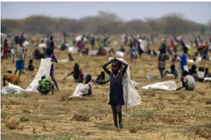
Figure 6. La famine au Yémen