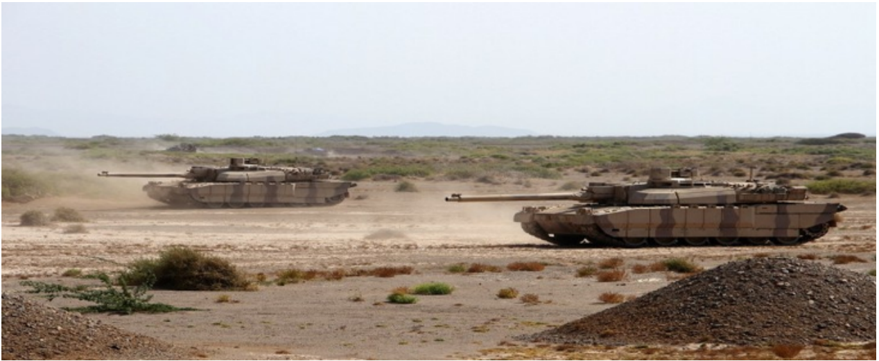
Figure 5. Le Yémen, un pays en guerre menacé par la famine.