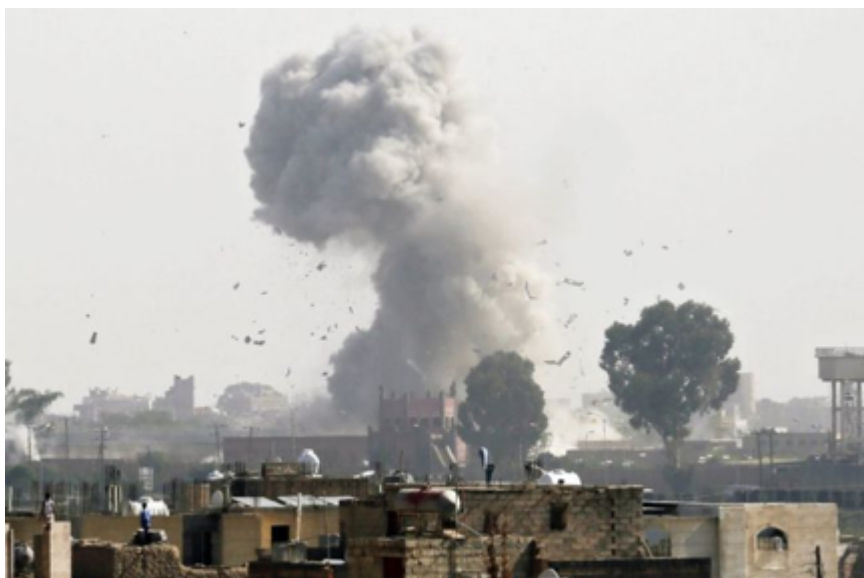
Figure 4. Yémen. Les frappes de la coalition arabe et les États-Unis sèment la mort