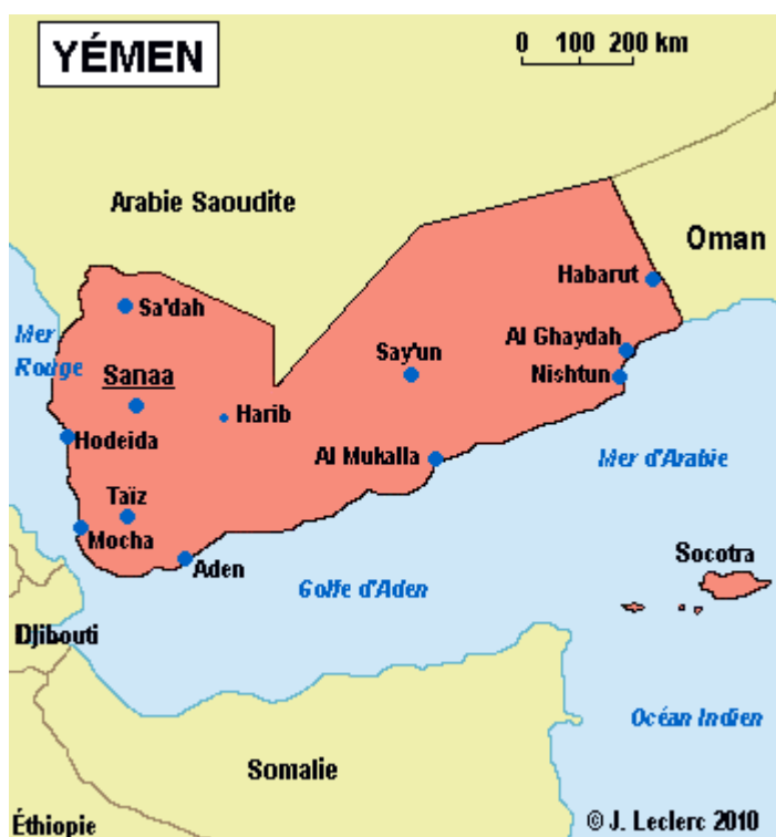
Figure 2. Carte politique du Yémen