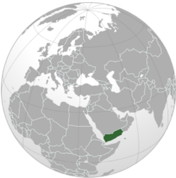
Figure 1. Localisation du Yémen